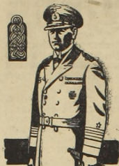
Zeit dem Jahre 1936 gibt es bei der deutschen Kriegsmarine die Dienstangabe des Generaladmirals.