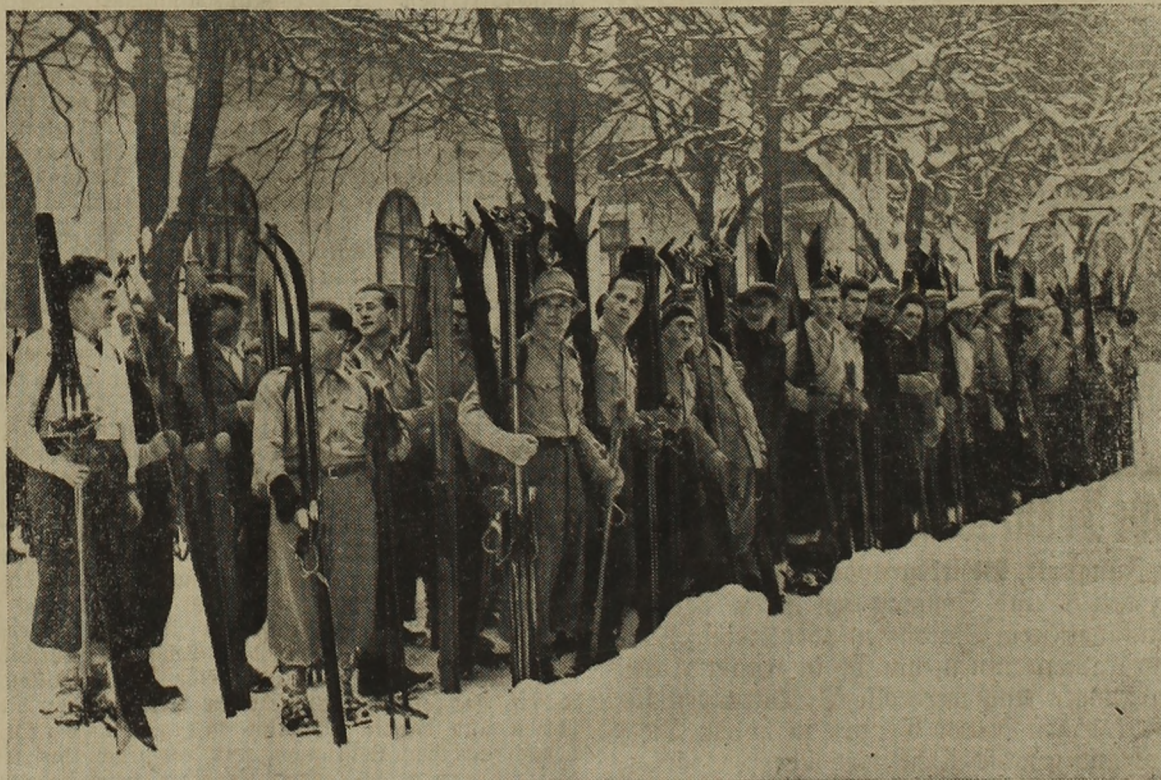
Turnverein „Luzkow“ eröffnet die heurige Schifaison.