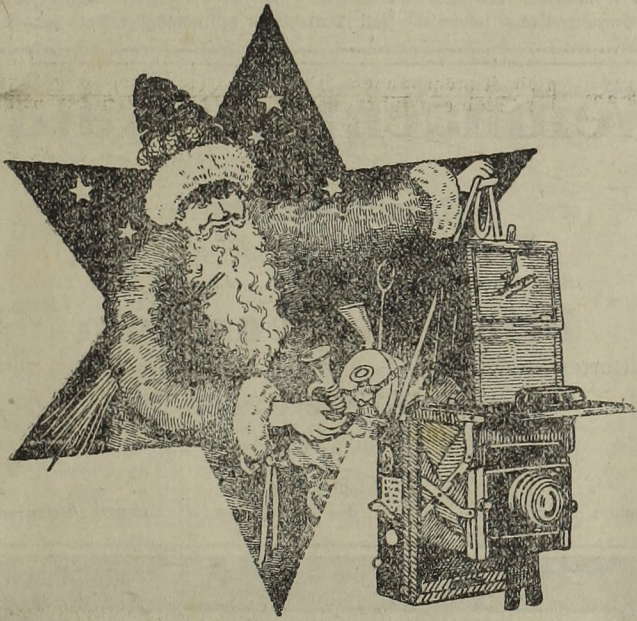
Photo-Apparate Parfümerie-, Kamm- und Maniküre-Geschenk-Kassetten, Rasierapparate