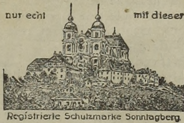
Registrierte Schutzmarke Sonntagberger

haben Sie ein Vermögen, wenn Sie nicht mit dem echten Sonntagberger Feigen- u. Malzkaffee gekocht haben.