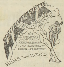
Waidhofen a. d. Ybbs, Urtal.

bei Neulengbach (Wiener Lokalverkehr) 5 Wohnräume, große Veranda, Stallungen, großer Obst- u. Gemüsegarten etc., ganzes Haus sofort beziehbar, gegen ähnliches in oder bei Waidhofen zu vertauschen, bezw. zu verkaufen. Auskunft in der Verwaltung des Blattes. 202