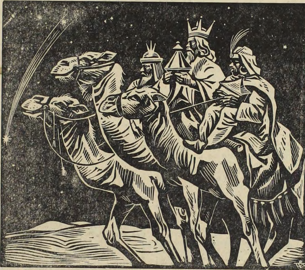
Auf dem Wege nach Bethlehem

weiß Gerechtigkeit zu üben und an die Stelle des Hasses Liebe zu setzen. Das Kind in der Krippe hat die Erlösung des Menschengeschlechtes aus Not und Leid begonnen und hat den Fortgang dieser Erlösung dann den Menschen anvertraut. Das haben wir bis heute wohl nicht ver-