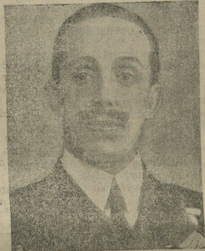
der diese Regierungen eingesezt hat, wegen Hochverrat angeklagt.

Das spanische Parlament hat zwanzig frühere Minister der Diktaturregierungen und den König Alfons (Bild),