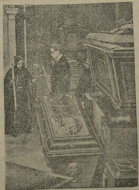
hat das Volk nach der Ansicht der christlichsozialen Kavag keine anderen Sorgen, als liebevolle Schilderungen der Grabstätten der Habsburger anzuhören. Auf unserem Bild ist der Besuch des Radiosprechers in der Gruft festgehalten. Im Vordergrund der Sarg des mütterlicherseits habsburgischen Sohnes Napoleons I., des Herzogs von Reichstadt.

Am Allerheiligenfest hat Radio-Wien eine Uebertragung aus der Wiener Kapuzinergruft geboten. Der Kavag-Sprecher ging mit dem Vater Gruftmeister durch die große Gruft, in der die Särge der verstorbenen Habsburger einer neben dem andern stehen. In dieser Zeit der schlimmsten Not