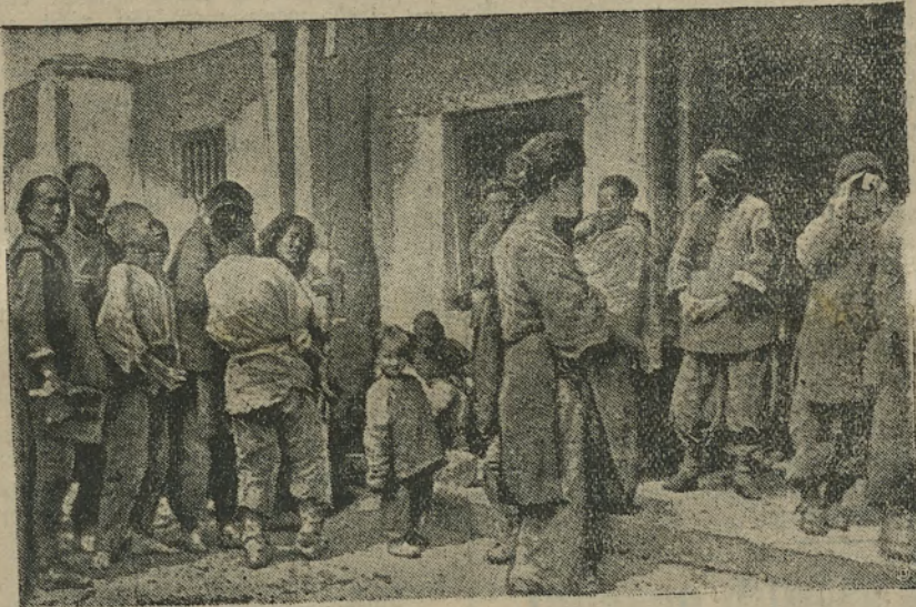
schämten) Forderungen Japans angenommen habe. — Unser Bild zeigt eine Bahnstation an der mandschurisch-chinesischen Grenze. Die Bewohner vieler mandschurischer Dörfer sind vor den japanischen Eindringlingen geflohen. Sie haben nicht einmal die notwendigste Habe mitgenommen.

Die japanische Regierung weist auf alle Vorschläge und Ermahnungen des Völkerbundes. Sie hat erklärt, die japanischen Truppen würden erst dann aus der Mandschurei zurückgenommen werden, wenn China die (unver-