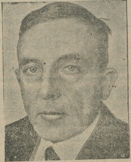
gänge bei der Atmung der menschlichen Zellen aufzuklären. Auch um die Erforschung der Krebskrankheit hat sich Warburg sehr verdient gemacht.

Kürzlich bekam der Berliner Gelehrte Professor Dr. Otto Warburg den heurigen Nobelpreis für Medizin. Seine Forschungen haben wesentlich dazu beigetragen, die Vor-