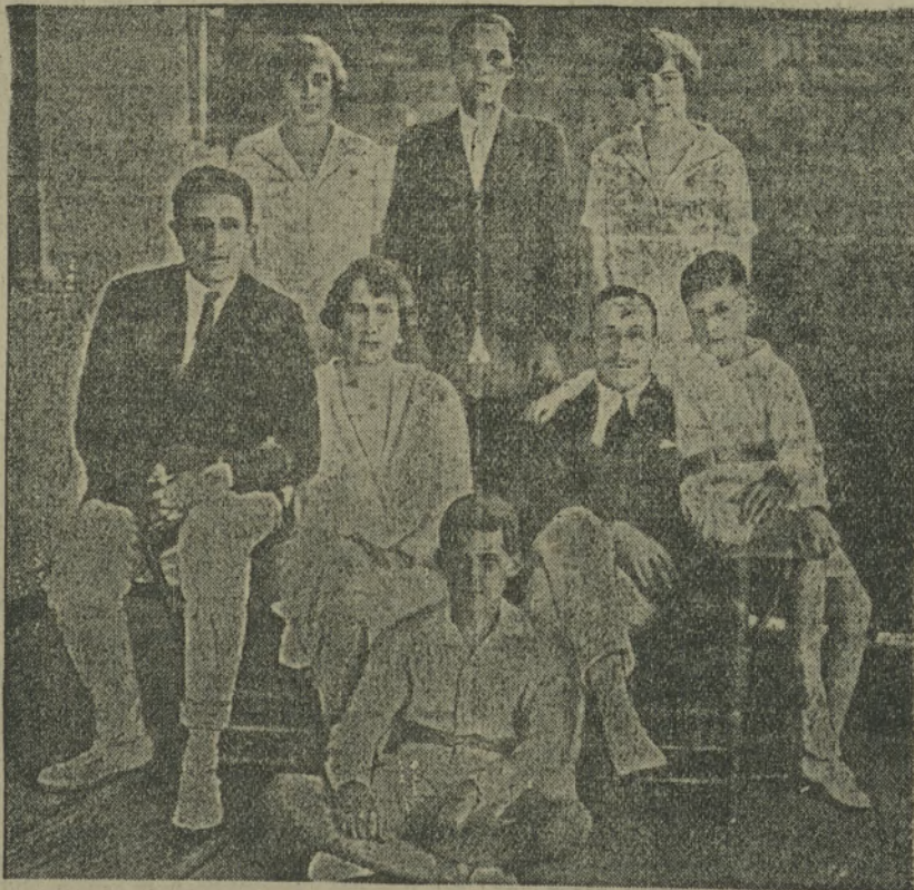
hin ab, sich an den Wahlen zur Verfassung gebenden Nationalversammlung zu beteiligen. Sie erklären, die Revolution ist nur aufgeschoben, nicht gescheitert. Die neue Regierung versucht es also vorläufig mit dem Fortwursteln. — Unser Bild zeigt den König Alfons mit seiner Gattin und den sechs Kindern. Auch wenn der Mann „arbeitslos“ werden sollte, werden seine Kinderchen nicht verhungern.

König Alfons von Spanien hat seinen mackelnden Thron noch einmal gerettet. Der Admiral Ugarr hat doch noch eine reaktionäre, monarchistische Regierung zusammengebracht. Diese neue Regierung versucht es, Wohlgefallen bei den Republikanern und Sozialisten zu finden. Es gelingt ihr aber nicht. Die Linksparteien lehnen es weiter-