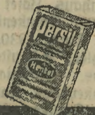
In der grünen Packung und dem Namen Henkel im roten Felde

Wenn Ihnen das jemand sagt, dann sollten Sie mißtrauisch werden. Persil gibt es nur in der bekannten grünweißen Packung mit dem Namen Henkel im roten Felde, niemals lose oder in anderer Packung. Weisen Sie im eigenen Interesse alle minderwertigen Erzeugnisse, die Ihnen als „dasselbe wie Persil“ oder „ebenso gut wie Persil“ angeboten werden, zurück und halten Sie sich an das täglich in Millionen Haushaltungen bewährte