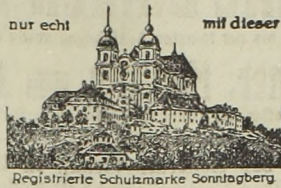
Registrierte Schutzmarke Sonntagberg

haben Sie ein Vermögen, wenn Sie nicht mit dem echten Sonntagberger Feigen- u. Malzkaffee gekocht haben.