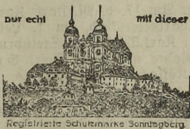
Registrierte Schutzmarke Sonntagberger

ist es, daß Sie den echten Sonntagberger Feigen- und Malzkaffee noch nicht versucht haben.