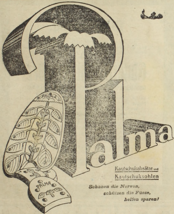
Kautschukabsätze und Kautschuksohlen