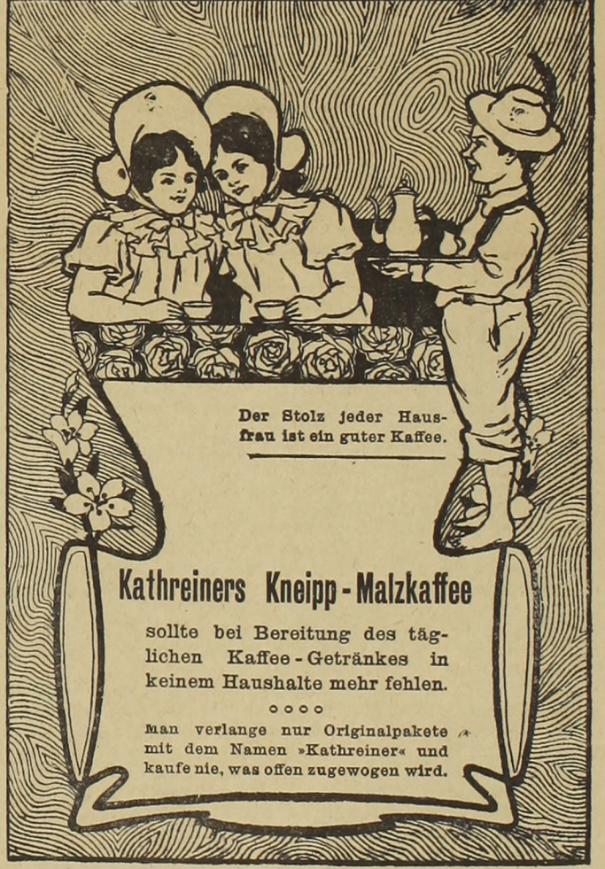
Der Stolz jeder Hausfrau ist ein guter Kaffee.

Etabliert 1864 F. Berlyak Telephon 3729 Wien I. Verlängerte Weihburggasse Nr. 27