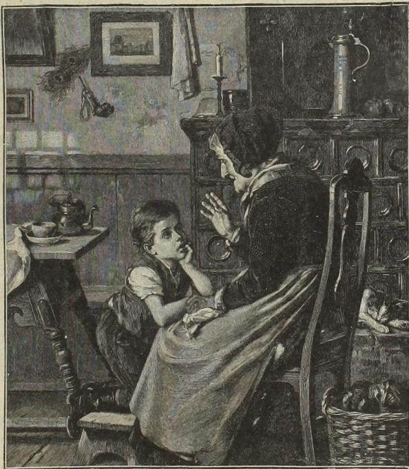
Das Märchen. Von F. Hilbemann.

„Und weshalb nicht? Du bist noch jung und kräftig, ein