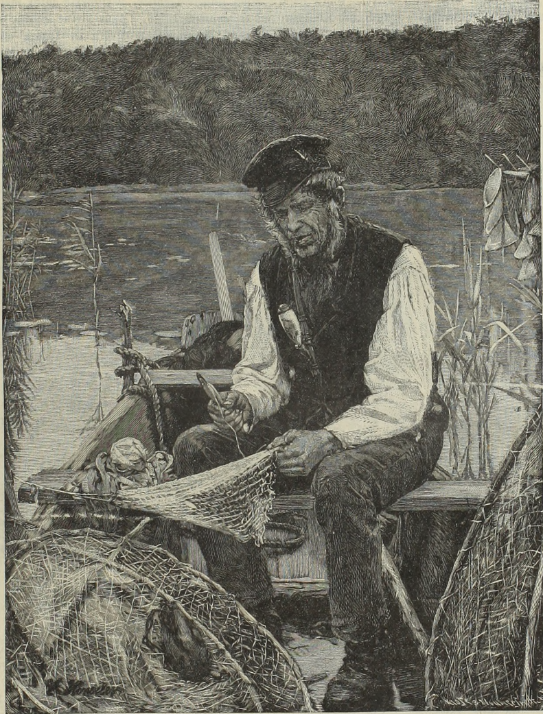
Der alte Fischer.

„Ich komme, um Ihnen einen Trost zu bringen, den einzigen, wonach Sie sich vielleicht noch sehnen werden; mein Kamerad