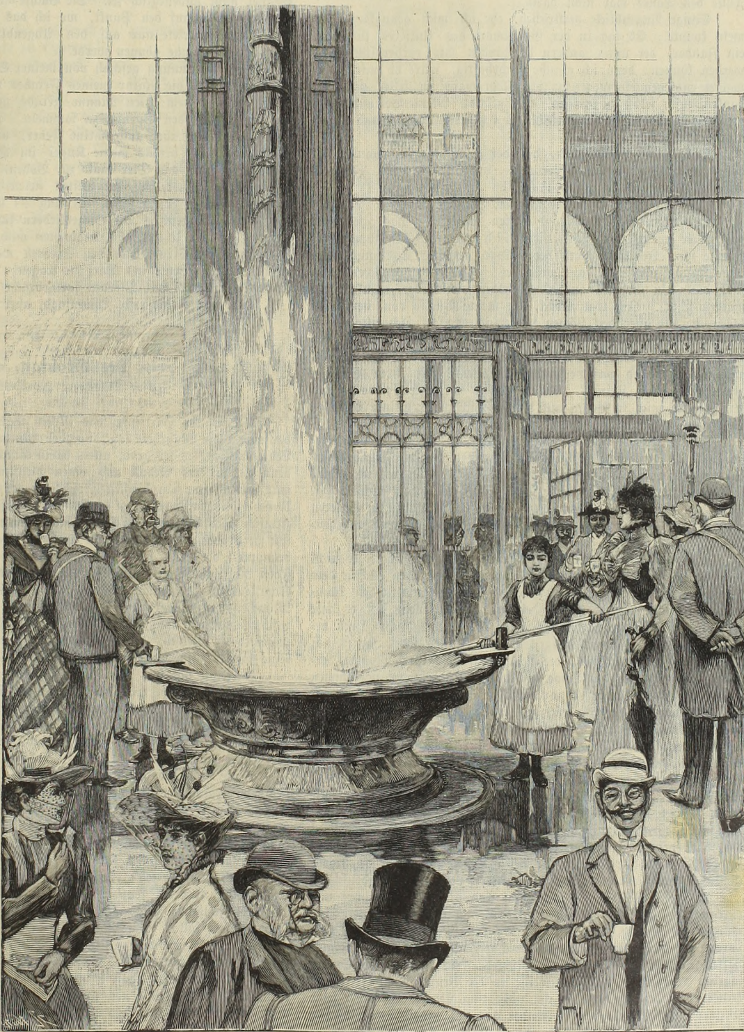
Der Sprudel in Karlsbad.

kennen; aber ich hatte nur Tiere gesehen, welche man für besonders große Hunde hätte halten können im Vergleich mit dem Tiere, das ich damals vor mir hatte. Er hatte sich ausgerichtet und starrte uns an. Sein ungeheurer Körper, seine zottige Mähne, bei der jedes Haar sich zornig ausgerichtet hatte, seine großen Augen, gleich glühenden Kohlen, sein langer Schweif, der langsam sich hin- und herbewegte, und das entsetzliche Gebrüll, das gleich einem Donner das Tal erschütterte — alles machte seine Erscheinung zu einer