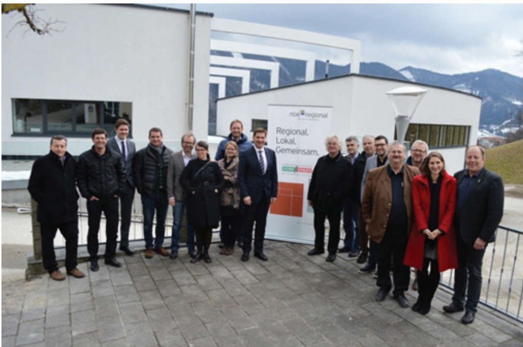
Klausur Stadterneuerung in Konradsheim, 28. Februar 2015.