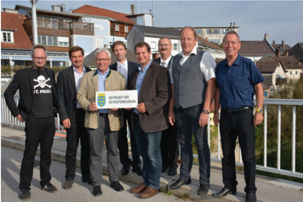
„Startschuss“ zur NÖ Stadterneuerung, 18. September 2014.