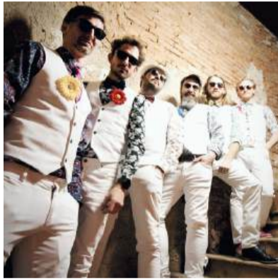
Palm Beach Drive bringen Film- und Serienklassiker live auf die Bühne.

Am 15. August wird der Schlosshof zur Bühne für einen besonderen Konzertabend. Während Groove Pie mit Funk, Soul und Rock für Stimmung sorgt, bringt Palm Beach Drive die schönsten Melodien aus Film- und Serienklassikern live auf die Bühne.