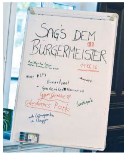
Die Jugendlichen sammelten ihre Ideen für die Zukunft der Stadt.

viktgartens standen ganz oben auf der Wunschliste.