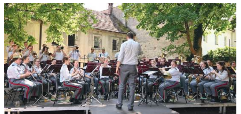
Am 5. Juli starten die gemütlichen Frühschoppenkonzerte mit Blasmusik und Kulinarik im idyllischen Konviktgarten.

Fotos von Florian Böhm dokumentieren die Stadtgeschichten und für die musikalische Begleitung sorgt ein Ensemble der Musikschule Waidhofen.