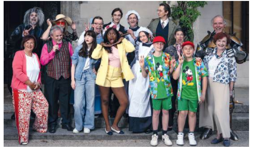
14 Schauspielerinnen und Schauspieler – darunter auch junge Talente – stehen heuer bei den Schlosshofspielen der Volksbühne Waidhofen auf der Bühne.