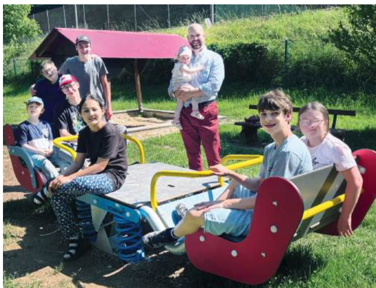
Die neue Attraktion ermöglicht Kindern mit unterschiedlichen Fähigkeiten gemeinsames Spielen und ist ein weiterer Schritt auf dem Weg zu einer familienfreundlichen und barrierefreien Stadt.