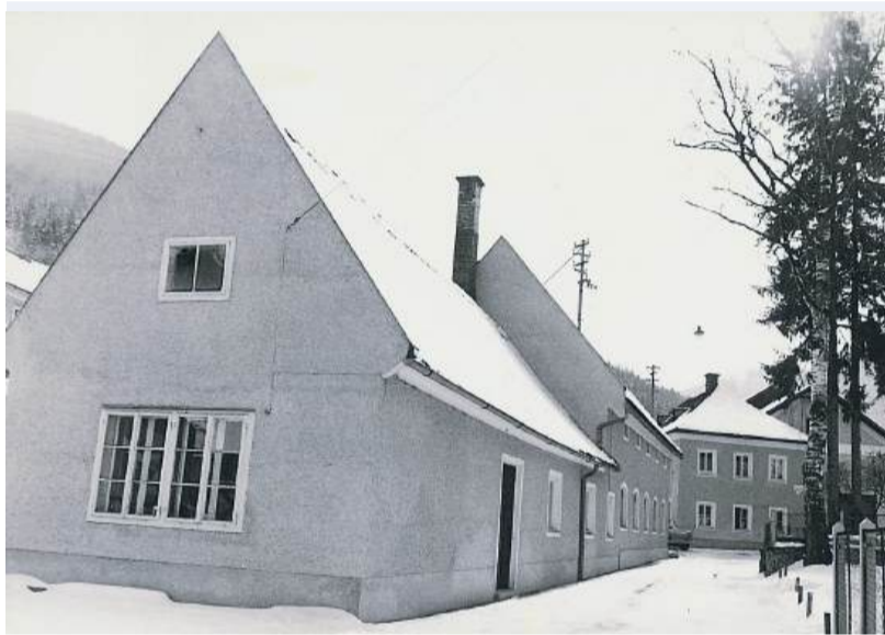
Der erste Unternehmensstandort in der Hammergasse in Waidhofen/Ybbs: Hier legte Franz Forster im Jahr 1956 den Grundstein für die heutige Forster-Gruppe.

hofen verwurzelt und zugleich weit über die Region hinaus tätig ist. Der Grundstein dafür wurde im Jahr 1956 gelegt, als Franz Forster das