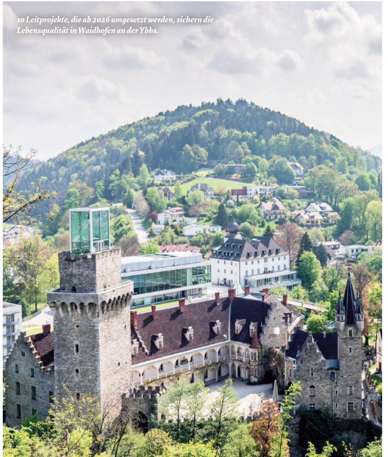
10 Leitprojekte, die ab 2026 umgesetzt werden, sichern die Lebensqualität in Waidhofen an der Ybbs.

Informieren Sie sich im Innenteil ab Seite 7 über die einzelnen Leitprojekte oder besuchen Sie ab 30. Juni die Ausstellung dazu im Offenen Rathaus.