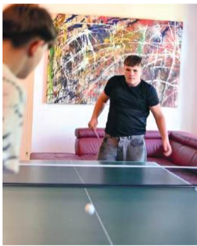
Das Jugendzentrum bietet auch Action und Bewegung.