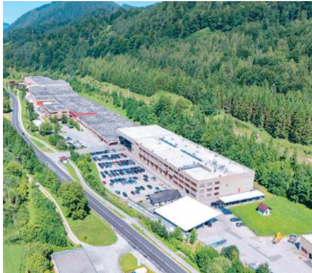
Die Zentrale der Forster-Gruppe in Waidhofen an der Ybbs.

Wer heute auf die erfolgreiche Entwicklung von Forster blickt, sieht ein Unternehmen, das fest in Waid-