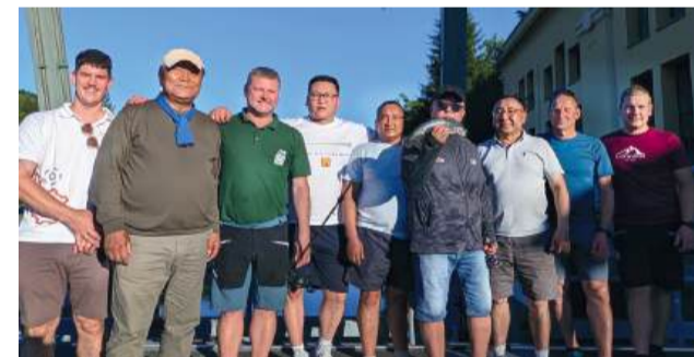
Mit den heimischen Fischern nutzen die Gäste aus der Mongolei sowie IFE-Mitarbeiter die Gelegenheit, die Ybbs kennenzulernen.