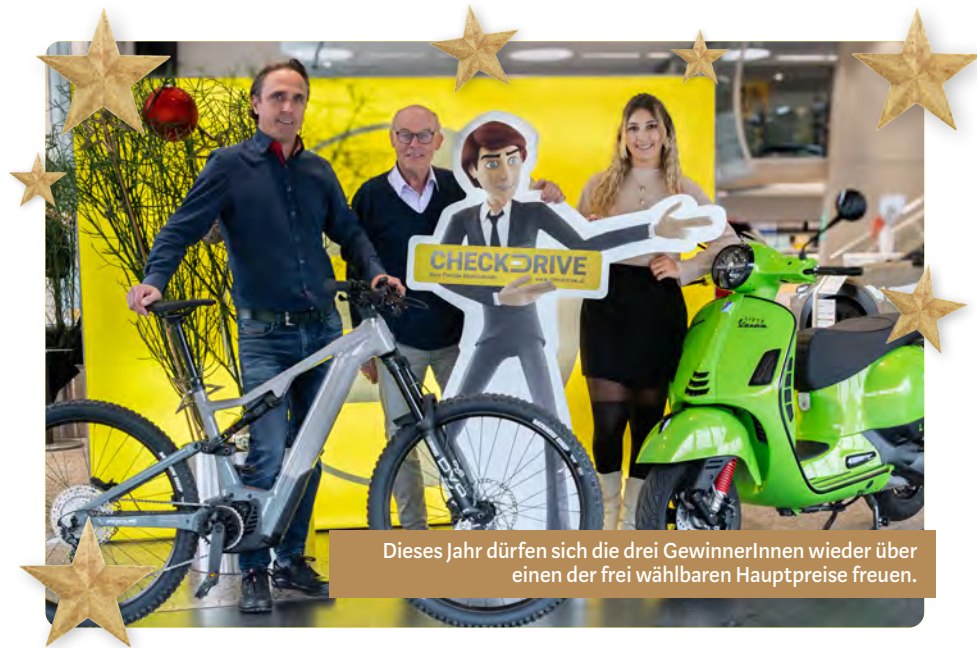
Dieses Jahr dürfen sich die drei GewinnerInnen wieder über einen der frei wählbaren Hauptpreise freuen.

Teilnahme leicht gemacht: Einfach 24 kleine Sterne oder einen großen Stern auf der Vorderseite der Gewinnkarte anbringen, Karte vollständig ausfüllen und in einem teilnehmenden Geschäft bis zum 7. Jänner 2025 abgeben.