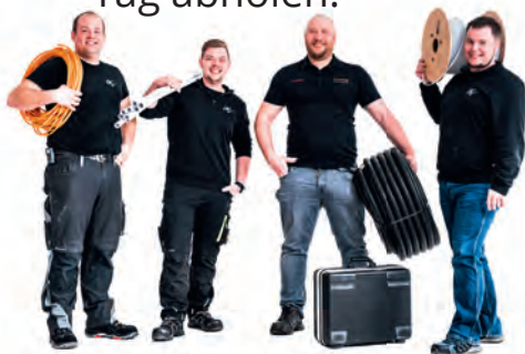
*nur auf Lagerware

Material bestellen und am selben Tag bzw nächsten Tag abholen!*