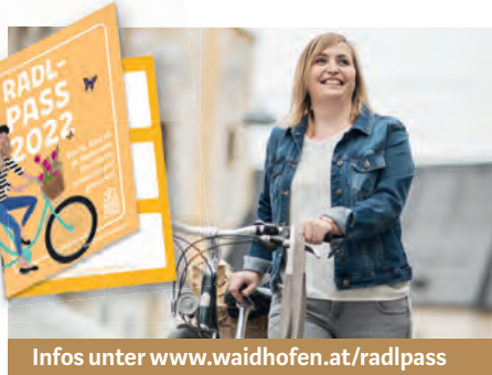
Infos unter www.waidhofen.at/radlpass

Die mehrfache Teilnahme ist möglich und steigert die Gewinnchancen!