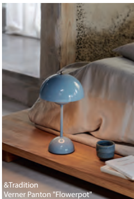
&Tradition Verner Pantone "Flowerpot"