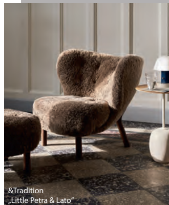
&Tradition „Little Petra & Lato“