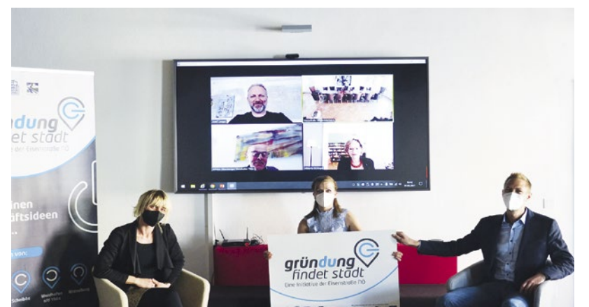
Die Teilnehmer der hybriden „Gründung findet Stadt“-Jurysitzung freuen sich über den Zuwachs am Hohen Markt in Waidhofen an der Ybbs.

Die Tickets in der Stadtgemeinde Wieselburg und Stadt Waidhofen a/d Ybbs sind damit bereits vergeben. Die Bewerbung für weitere Bonus-Gründertickets ist bis 11. Juni auf www.gruendungfindetstadt.at bei Projektleiterin Bettina Rehwald unter M+43 664/266 00 14 oder per E-Mail an