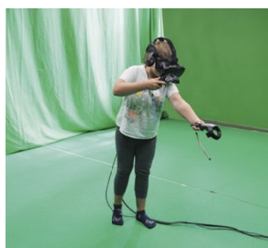
Das summercamp-4-kids wartet wieder mit einem spannenden Ferienprogramm auf die Kids.

Alle Informationen sowie die Möglichkeit zur Anmeldung gibt es hier: www.zukunftsakademie.or.at/summer-camp/ .