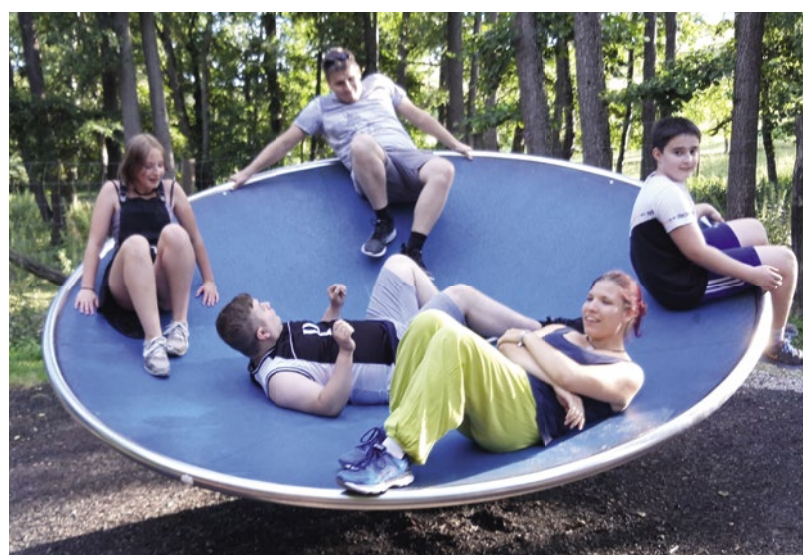
Das Jugendzentrum Bagger freut sich auf einen bunten Sommer mit Spiel, Sport, Spaß und vielen gemeinsamen Ausflügen

Für die Teilnahme an den Programmpunkten ist ein Test- oder Impfnachweis mitzubringen.