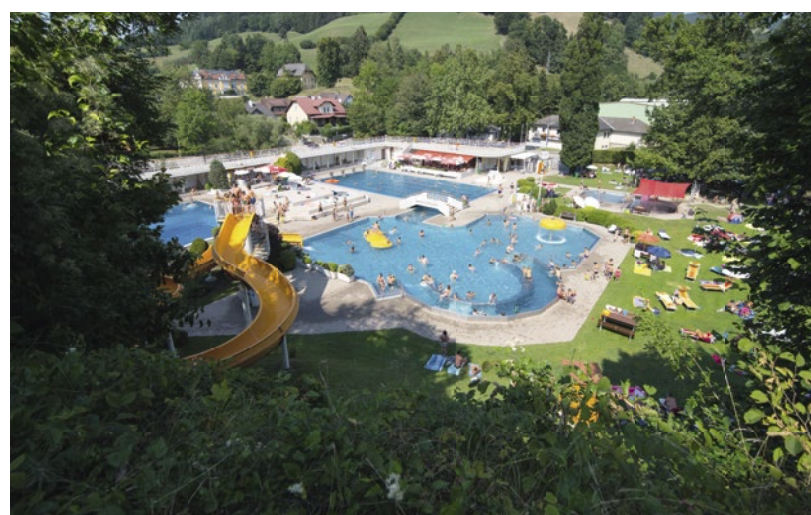
Mitten im Stadtzentrum und trotzdem umgeben von grüner Natur. Das Waidhofner Parkbad lockt mit kühlem Nass und angenehmen Schattenplätzen.

Erholung und Schutz stehen im Naturpark Ybbstal ganz besonders im Fokus. Der von Mischwald bedeckte Buchenberg, das kristallklare Wasser der Ybbs oder das imposante „Ofenloch“: Wertvolle Lebensräume und heimische Tierarten können hier das ganze Jahr lang entdeckt werden. Ein besonders wertvoller Schatz ist der Steinkrebs, der im Naturpark beheimatet ist. Er versteckt sich in kleinen Bächlein unter Steinen und entzückt mit etwas Glück den ein oder anderen wahren Natur-entdecker!