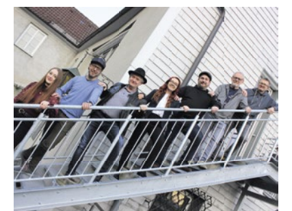
Die siebenköpfige Gruppe „sappalott“ spielt bekannte und auch eigene Stücke

Dan Anfang machen am 8. Juli „die STEINBACH“ mit zeitgenössischer Volksmusik. Frisch erholt und abgestaubt treffen sich Dialekttext und Volksmusik im 21. Jahrhundert. wieder. Das Programm „Stadt.Land.Lied“ ist eine Mischung aus Tradition und Moderne – so werden Elemente aus dem Wienerlied und alpiner Volksmusik geschickt zu einer Österreichischen Weltmusik verwoben. Minimal Music und Jazz treffen auf