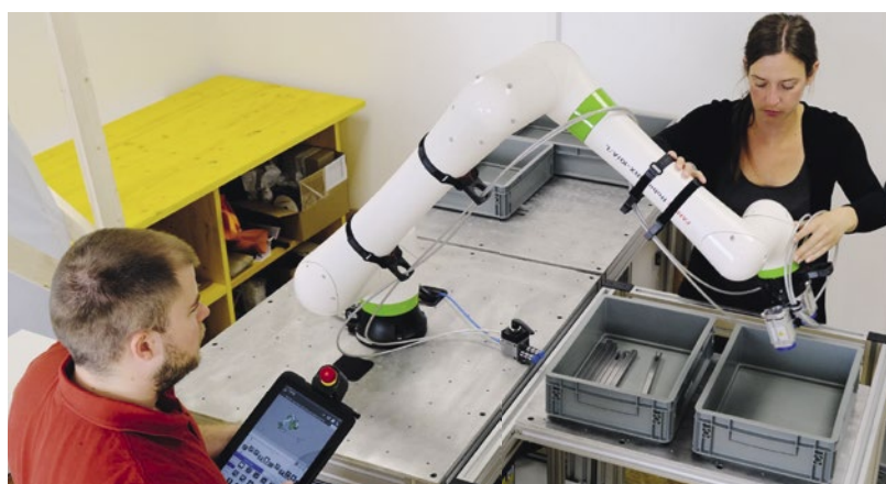
Ein „Griff in die Kiste“ wird mit dem kollaborativen Roboter der Firma Fanuc Österreich GmbH ermöglicht.

Die beta factory ist mit Hightech-Maschinen ausgestattet und bietet Raum zum Forschen, Experimentieren und Bauen von Prototypen. Mit dem Lasercutter der Firma Trotec Laser GmbH ist es möglich, Materialien wie Glas oder Metall zu gravieren und alle organischen Materialien wie beispielsweise Holz zu schneiden: von Schlüsselanhängern über Türschilder bis hin zu Glasflaschen sind dem Experimentieren fast keine Grenzen gesetzt. Am kollaborativen Roboter (Cobot) der Firma Fanuc Österreich GmbH wird derzeit die erste Anwendung „Griff in die Kiste“ entwickelt. Diese Anwendung wird unter anderem für das kürzlich gestartete Pro-