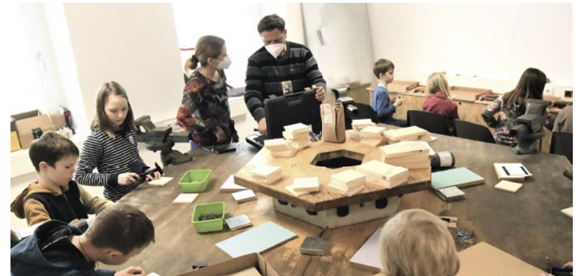
Die Kids profitieren vom abwechslungsreichen Programm mit Spaßfaktor und die Eltern von der Möglichkeit eines zusätzlichen Betreuungsangebotes in Waidhofen / Ybbs.

oder klassisches Handwerk kennenzulernen und spielerisch zu erfahren. Die Betreuungsmöglichkeit beginnt bereits um 13.00 Uhr, das inhaltliche Programm startet um 14.00 Uhr. Das Angebot ist noch bis Juni kostenlos, danach belaufen sich die Kosten pro Nachmittag auf 10 Euro. Eine Anmeldung ist jeweils bis eine Woche vor dem Termin möglich. Alle Informationen, die Details zum Programm sowie die Möglichkeit zur Anmeldung sind auf der Website beta-campus.at/beta-kids/ zu finden.