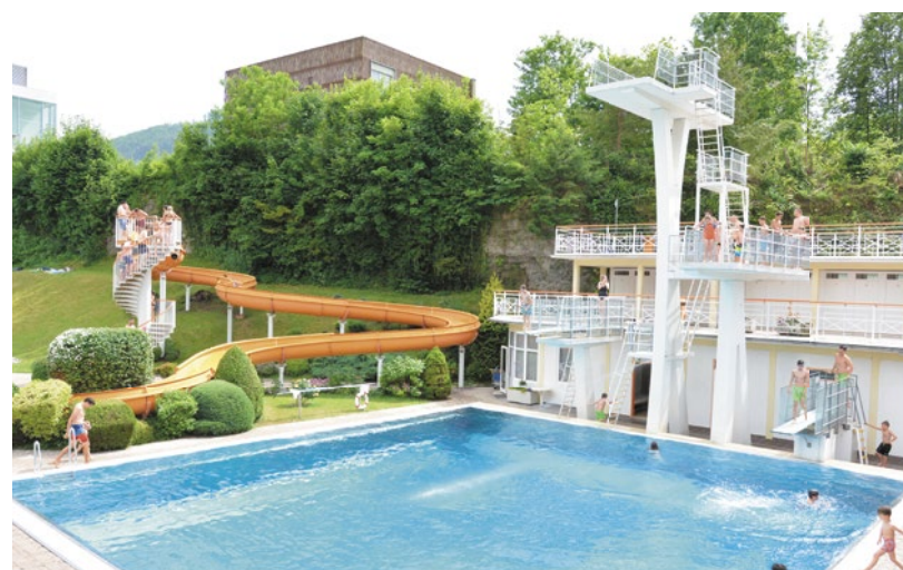
Spaß und Action gibt es im Erlebnisbecken mit Wasserrutsche sowie im Sprungbecken mit 10-Meter-Turm.

spaß für Babys und Kleinkinder gibt es im Babybecken unter einem großen Sonnensegel. Wer sich sportlich betätigen will, ist am Beachvolleyball- und am Streetballplatz bestens aufgehoben. Eine große Liegewiese mit natürlichen Schattenplätzen, ein abenteuerlicher Kinderspielplatz sowie eine gemütliche Gastronomie ergänzen das Angebot. In den Sommermonaten ist das Bad bis in die späten Abendstunden geöffnet.