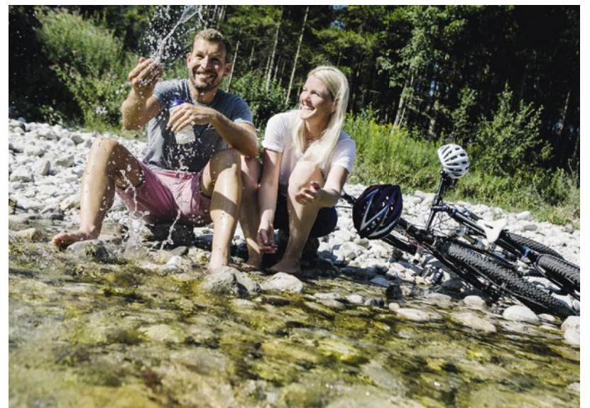
Der Ybbstalradweg bietet Naturerlebnis, Erholung und Genuss auf der ganzen Linie. Auch eine Abkühlung in der glasklaren Ybbs darf dabei nicht fehlen.

Die Radkarte „Fluss-Radeln“ informiert über Streckenverlauf, Ausflugsziele und Gastgeber sowie viele weitere Details zum Ybbstalradweg. Zu bestellen ist diese unter folgendem Link: www.mostviertel.at/radkarte-flussradeln