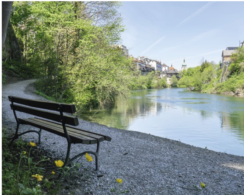
Die Ybbs als verbindendes Element der beiden Naturpark-Gemeinden bietet in den heißen Sommermonaten eine willkommene Abkühlung.

Vielfältige Routen in unterschiedlichen Schwierigkeitsstufen ermöglichen ein Wandererlebnis für die ganze Familie. Besonders beliebt bei Einheimischen und Gästen sind die schönen Touren am Buchenberg. Auf Wanderungen am Buchenberg können die Obere und die Untere Kapelle, der Jubiläumsbrunnen und der Kapuzinerbrunnen entdeckt werden. Von leicht bis sportlich herausfordernd findet jeder Wanderer auf dem Berg im Herzen von Waidhofen