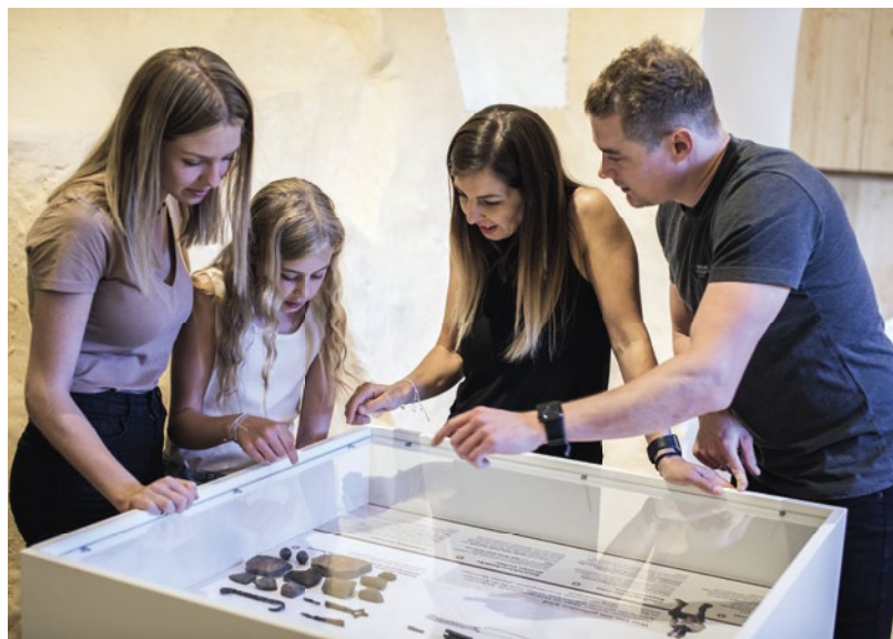
Der Schauraum im Keller der Kirche: Zu den üblichen Kirchen-Öffnungszeiten ist dieser ab sofort frei zugänglich.