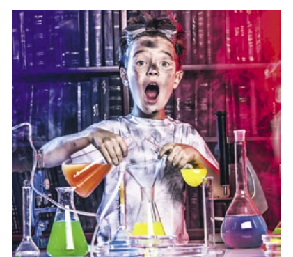
Von 6. bis 8. Juli wird die Stadt Waidhofen wieder zum Uni-Campus für junge Entdecker.

Im KinderUNIversum sind die Kinder und Jugendlichen nicht nur bestens betreut – sie können hier ihre Leidenschaften und Talente entdecken, sich kreativ entfalten und viel Neues lernen! Die Anmeldung ist noch bis 28. Juni möglich, ab 30. Juni können Ausweise, T-Shirts und Kapperl bei der Infostelle der Ybbstaler Alpen abgeholt werden.