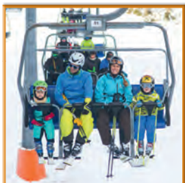
Familien-Saisonkarte im Wert von Euro 550,- Skigebiete Forsteralm & Königsberg