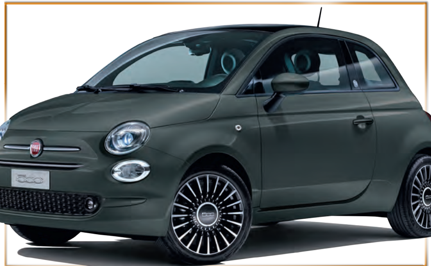
Fiat 500 Hybrid in der Trendfarbe Carrara-Grau von Autohaus Lietz & Verein Stadtmarketing