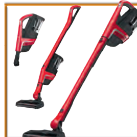
Miele-Akkusauger „Triflex“ im Wert von Euro 499,- von Elektro Oberklammer