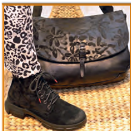
Stiefelette & Tasche von Think! im Wert von Euro 500,- von Schuhhaus Watzinger