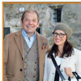
Modegutschein für Sie und Ihn im Wert von Euro 500,- von Pöchhacker – Mode zum Stadtturm & Woman Moden