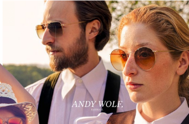
Retro-Brillen – gesehen bei Hatzmann