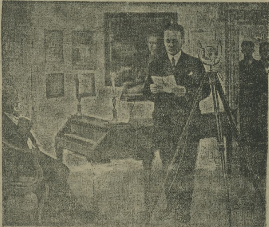
Am 27. Jänner war der 175. Geburtstag des großen Tonbilders Mozart. Unser Bild zeigt die schlichte Feier, die an diesem Tage in seinem Geburtszimmer in Salzburg stattgefunden hat. Man sieht darauf das kleine Klavier, auf dem der junge Mozart seine ersten Werke gespielt hat. Vor dem Klavier steht der bekannte Schriftsteller Franz Karl Ginzkey, der die Festrede hält, die auch im Radio zu hören war.