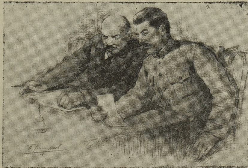
Stalin und Lenin