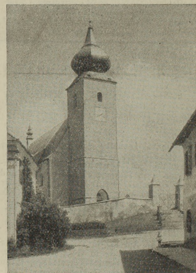
St. Leonhard a. W.

Ausflug nach St. Leonhard am Wald lohnt sich ganz bestimmt, zumal man denselben mit einer gemütlichen Höhenwanderung zum Sonntagberg hinüber verbinden kann. Wer dieses Gebirgsdörflein einmal besucht hat, wird es bestimmt auch lieb gewinnen. Berger.