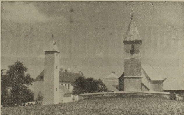
St. Georgen i. d. Klaus

Aber auch vor Kriegsschäden wurde die inzwischen zur Kirche erweiterte Kapelle nicht verschont. So berichtet die Chronik über Kriegsschäden in den Jahren 1529, 1800, 1805 und 1809. Der Brand wütete im Jahre 1529 beim ersten Türkeneinfall.