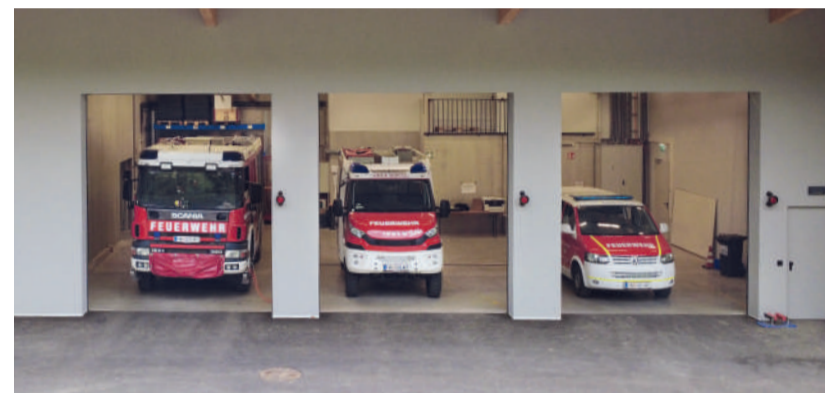
Die neue Fahrzeughalle bietet ausreichend Platz für die Einsatzfahrzeuge und wichtiges Equipment.

Mit Führungen durch das neue Feuerwehrhaus.