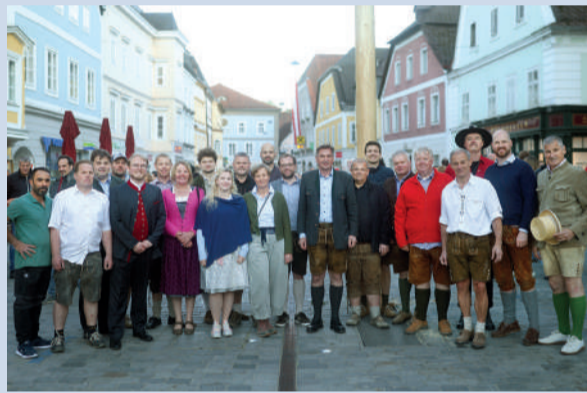
<<< Gemeinsam Traditionen feiern Am 30. April wurde der Obere Stadtplatz einmal mehr zur Bühne gelebter Tradition. Bei herrlichem Wetter genoss Waidhofen ein großartiges Maibaum-Aufstellen.