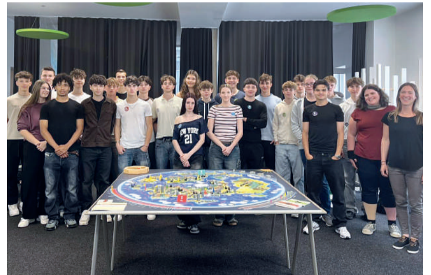
Drei Tage lang beschäftigten sich Schülerinnen und Schüler der HTL Waidhofen beim Future Lab „Change the Game“ am beta campus intensiv mit der Frage, wie wirtschaftliche Entwicklungen, gesellschaftliche Entscheidungen und ökologische Herausforderungen zusammenwirken.

misches Denken, Perspektivenwechsel und Entscheidungsfähigkeit unter Unsicherheit gefördert. Organisiert wurde das Future Lab von den Spielleiterinnen des beta campus und der net for future GmbH. Beide Organisationen fördern innovative Bildungsformate und Zukunftskompetenzen. Der beta campus versteht sich als Ort der Begegnung, an dem Lernen, Arbeiten und gesellschaftliche Innovation verbunden werden und junge Menschen praxisnahe Erfahrungen sammeln.