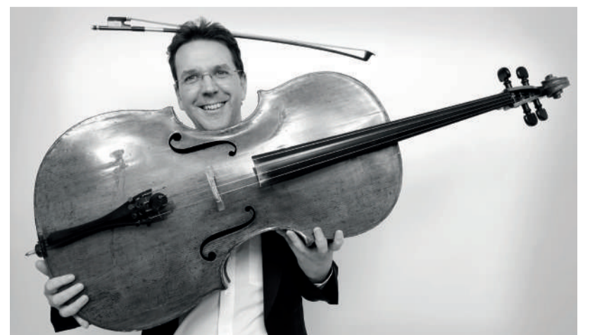
Der international renommierte Cellist Tamás Varga ist als Solist im Sommerkonzert des Waidhofner Kammerorchesters zu erleben.

das Cellokonzert in h-Moll sowie die Sinfonie Nr. 8 in G-Dur. Der Solist des Abends, Tamás Varga, zählt zu den herausragenden Cellisten seiner Generation und ist Solocellist der Wiener Philharmoniker. Dvořáks Musik verbindet dabei kraftvolle Emotionalität mit melodischer Leichtigkeit und zählt zu den Höhepunkten der romantischen Orchesterliteratur. Ein stimmungsvoller Konzertabend erwartet das Publikum.