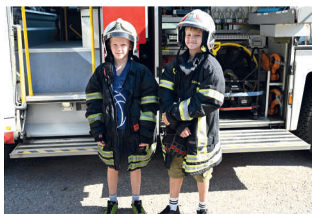
Auch in diesem Sommer wartet bei „Ferien Aktiv“ wieder ein buntes Programm mit jeder Menge Spiel und Spaß auf die Kids.

Sollte ein angemeldetes Kind kurzfristig nicht teilnehmen können, wird um eine Abmeldung gebeten (T +43 7442 511-330 oder per E-Mail an post.fjs@waidhofen.at ), damit Kinder von der Warteliste nachrücken können.