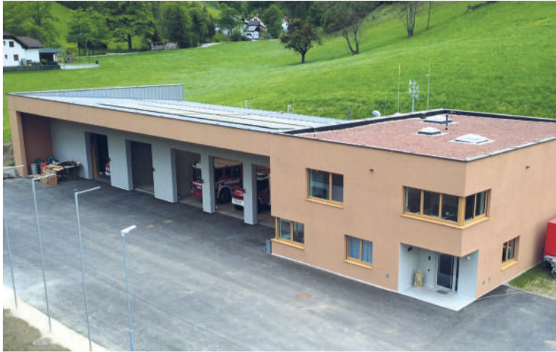
Tag der offenen Tür: Am 20. Juni können alle interessierten Waidhofnerinnen und Waidhofner das neue Feuerwehrhaus in Wirts kennenlernen.