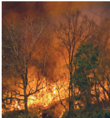
Brandgefährliche Handlungen in Waldnähe sind verboten.

entzünden oder zu grillen. Ebenso untersagt sind Rauchen sowie das Wegwerfen von Zigaretten und anderen brennenden Gegenständen wie Zündhölzern. Auch das Zurücklassen entzündlicher Materialien sowie von Glasflaschen und Glasscherben ist verboten, da dadurch eine sogenannte Brennglaswirkung entstehen kann. Darüber hinaus ist die Verwendung pyrotechnischer Gegenstände nicht erlaubt. Bitte helfen Sie mit, Brände zu verhindern, und halten Sie sich konsequent an die geltende Verordnung.