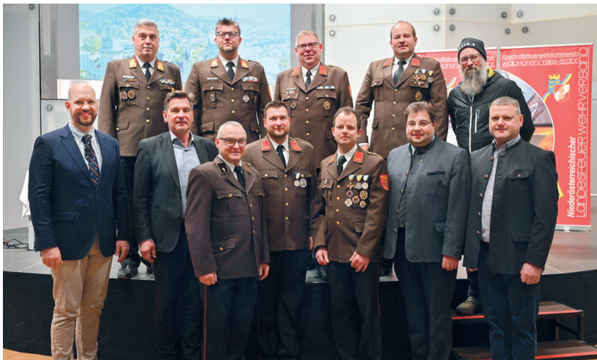
Die Kommandanten der Waidhofner Feuerwehren gemeinsam mit den Mitgliedern der Stadtregierung – ein starkes Zeichen für Zusammenarbeit und Sicherheit im Gemeindegebiet.