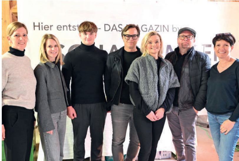
Das Team von „Schachinger Räume + Objekte“ freut sich bereits auf das neue Firmengebäude, das Tradition und Moderne verbindet.

Das nun gewählte Fachwerkhaus wird umfassend adaptiert und künftig auf zwei Geschossen genutzt. Im Erdgeschoß entsteht ein Ausstellungsbereich für Wohnen, im Obergeschoß werden offene Bürostrukturen sowie ein Farb-, Ma-