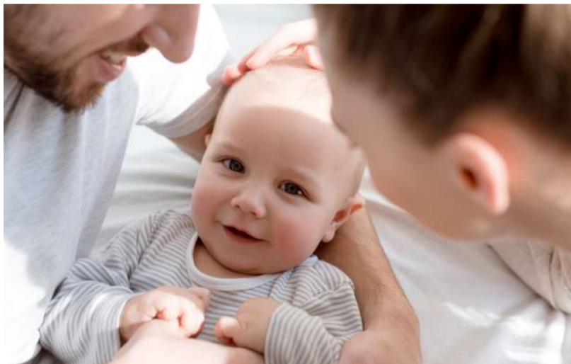
In Waidhofen findet die Mutter- und Elternberatung einmal im Monat statt und steht allen Familien offen.

Auch die onkologische Versorgung in Waidhofen/Ybbs wird weiterhin in Kooperation mit dem Klinikenverband Amstetten-Waidhofen/Ybbs, wo sich das Zentrum der Onkologie im Mostviertel befindet, angeboten. Diagnostik, Abklärung und operative Eingriffe finden weiterhin im Landeskrankenhaus Waidhofen/Ybbs statt. Die regionalen Tumorboards bündeln die Expertise aller beteiligten Fächer und ermöglichen eine individuell abgestimmte Behandlung für jede einzelne Patientin und jeden einzelnen Patienten. Auch hier werden die Patientinnen und Patienten durch die gemeinsame onkologische Versorgung durch den Klinikenverband Amstetten-Waidhofen/Ybbs profitieren.