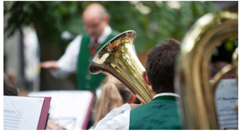
Am 5. Juli starten die Konviktgartenkonzerte. Den Auftakt gestaltet heuer die Trachtenmusikkapelle St. Leonhard am Walde.

Die Trachtenmusikkapelle Windhag feiert ihr großes Jubiläum mit einem stimmungsvollen Konzert im Konviktgarten sowie einem dreitägigen Zeltfest im Juli.