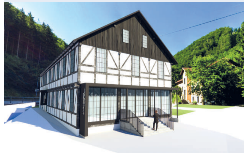
Das Fachwerkhaus in der Weyererstraße wird derzeit umfassend adaptiert und ab Ende Oktober auf zwei Geschossen genutzt.