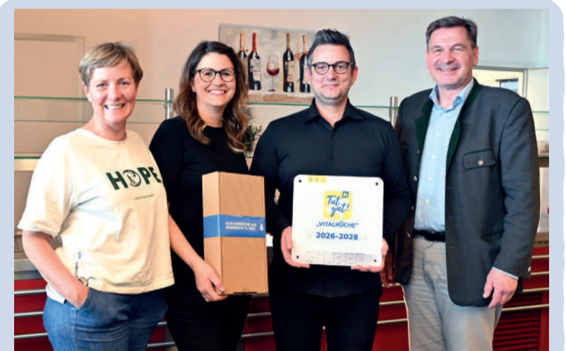
Das Theatercafé im Schulzentrum versorgt Schülerinnen und Schüler sowie Kindergartenkinder täglich mit frischen, regionalen Speisen. Dafür wurde die „Vitalküche Waidhofen/Ybbs“ von der Initiative „Tut gut“ mit der Silber-Plakette ausgezeichnet.

Die Vitalküche der Initiative „Tut gut“ sorgt für mehr Abwechslung in den Speiseplänen von Kindergärten, Schulen und anderen Gemeinschaftsverpflegungen. Ziel ist ein gesundes und schmackhaftes Angebot.