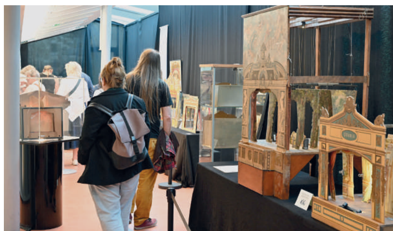
Der Musealverein Waidhofen präsentiert im Rahmen des Museumsfrühlings eine außergewöhnliche Ausstellung historischer Papiertheater aus dem 19. Jahrhundert.

Ein besonderer Ausstellungstipp erwartet Interessierte im Schloss Rothschild: „Die große Welt der kleinen Papiertheater“ begeistert noch bis 25. Mai mit liebevoll gestalteten Exponaten und faszinierenden Einblicken in die Welt der historischen Papiertheater. Die Ausstellung ist jeweils von Mittwoch bis Sonntag von 12.30 bis 17.30 Uhr im Pavillon des Schlosses geöffnet. Der Eintritt erfolgt gegen freiwillige Spende.