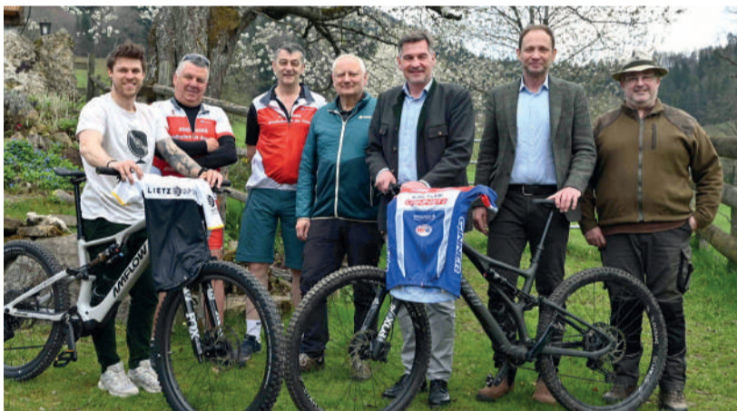
Das Projekt „Natur und Mensch“ in Waidhofen mit der Erschließung von Mountainbikestrecken in Atschreith wird um weitere fünf Jahre verlängert.

Mountainbike-Strecken: März–Oktober: 9.00–17.00 Uhr April–Sept.: 8.00–18.00 Uhr Mai–August: 7.00–19.00 Uhr