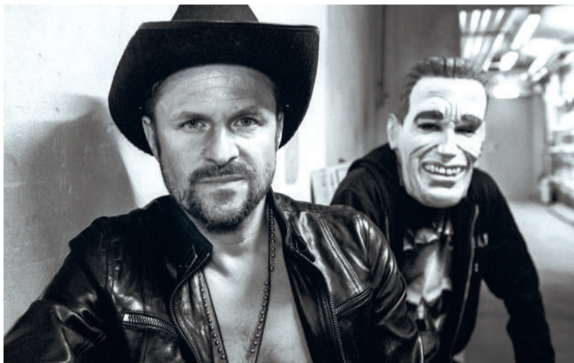
Philipp Hochmair gilt als der „Jedermann“ der zeitgenössischen Popkultur und begeistert mit seiner intensiven Bühnenpräsenz.