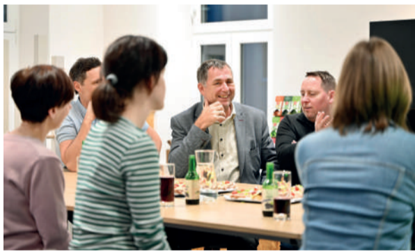
Der Bildungstammtisch ist ein Format im Rahmen des Bildungsdialogs. Er ermöglicht einen Austausch zu aktuellen Themen.