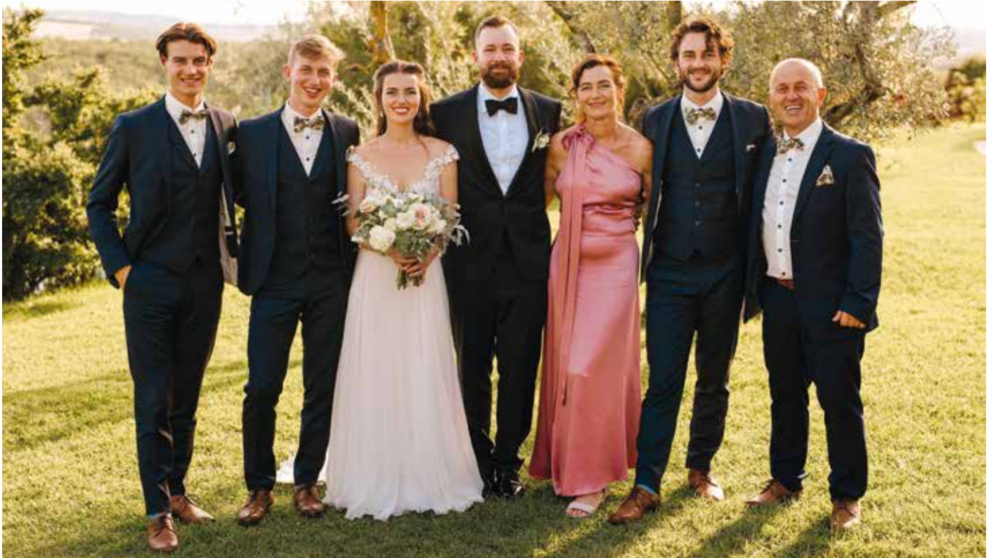
Familie Resch