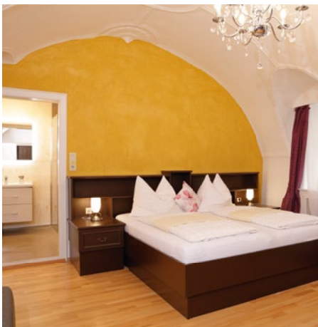
Die neu gestalteten Zimmer erfüllen alle Ihre Wünsche!

Wir begrüßen unsere Gäste ab 07:00 Uhr bei einem reichhaltigen Frühstücksbuffet. Beginnen Sie den Tag mit Cappuccino, Kaisersemmel und Fruchtejoghurt!