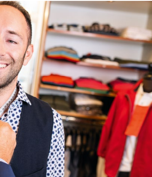
„Mode zum Stadtturm“ genau Maß genommen.

ciert und immer mutiger und größer inszeniert. Bouclés und Tweed sorgen für eine flauschige Wolloptik und ein Plus an Volumen, Flexibilität und Komfort, jedoch immer mit einer angenehm zu tragenden Leichtigkeit. Smarte Wertigkeit spielt auch bei Hemden eine zentrale Rolle um Casual und Business optimal kombinieren zu können.