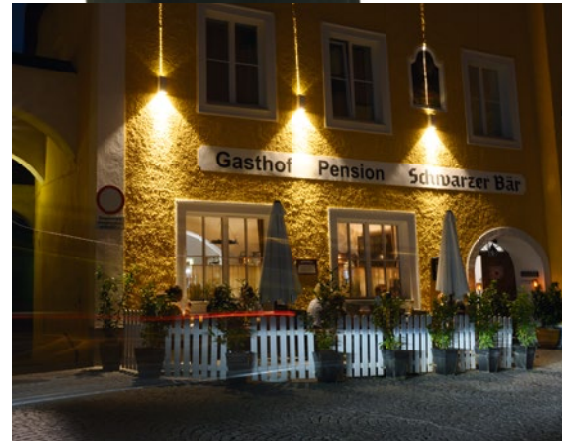
Der Gastgarten in der Ybbstorgasse