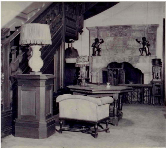
Kaminzimmer unter Louis von Rothschild

fürchtete, dass Waidhofen Schauplatz eines letzten verzweifelten Abwehrgefechts gegen die anrückenden sowjetischen Truppen sein würde. Diese deutschen Resteinheiten repräsentierten das, was von der lange propagierten und auch von den Alliierten gefürchteten Alpenfestung übrig geblieben war. Nur wenige Tage vor Kriegsende und mit einem Tag Vorsprung vor den aus dem Osten nahenden Sowjets rückten amerikanische Truppen, die sich in Steyr befanden,