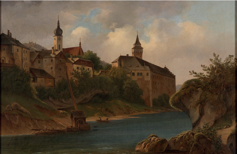
Schloss Waidhofen von Karl Wipplinger 1847

eingelassen durch den bayerisch-stämmigen Pfleger, in die Stadt ein und plünderten. Erst das Vorrücken der kaiserlichen Truppen mit Panduren-Oberst Trenk veränderte die Lage. Diese zweite Hälfte des 18. Jahrhunderts war ohnehin durch die ständig erweiterte Einflussnahme der landesfürstlichen Regierung gekennzeichnet, was sich 1785 durch die Magistratsregulierung unter Joseph II. abzeichnete. Der Freisinger Bischof musste erkennen, dass sein Herrschaftsgebiet