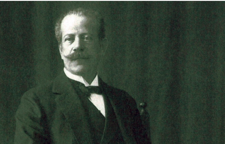
Albert Freiherr von Rothschild

Doch nicht nur am Schloss hinterließ Baron Rothschild seine Spuren. Gemeinsam mit dem liberalen Bürgermeister Theodor Freiherr von Plenker förderte er durch großzügige finanzielle Unterstützung die Infrastrukturprojekte des weitsichtigen Bürgermeisters, der damit der Stadt einen enormen Modernitätsschub er-