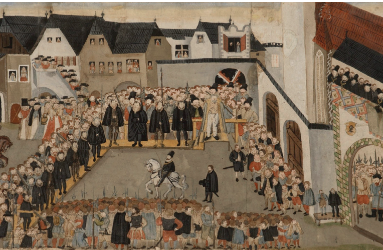
Der protestantische Stadtrat wird 1588 von der kaiserlichen Kommission verurteilt

Amstettner Tor entfernt und durch das österreichische Landeswappen ersetzt. Die darauffolgende Verurteilung und Vertreibung der protestantischen Oberschicht aus Waidhofen bedeutete für lange Zeit das Ende der Autonomiebestrebungen. Der wirtschaftliche Aderlass wurde noch durch zwei große Stadtbrände verschärft, die beide vom Schloss ausgingen und dazu führten, dass über einhundert Häuser in der Innenstadt leer standen. Für das Schloss hatte man