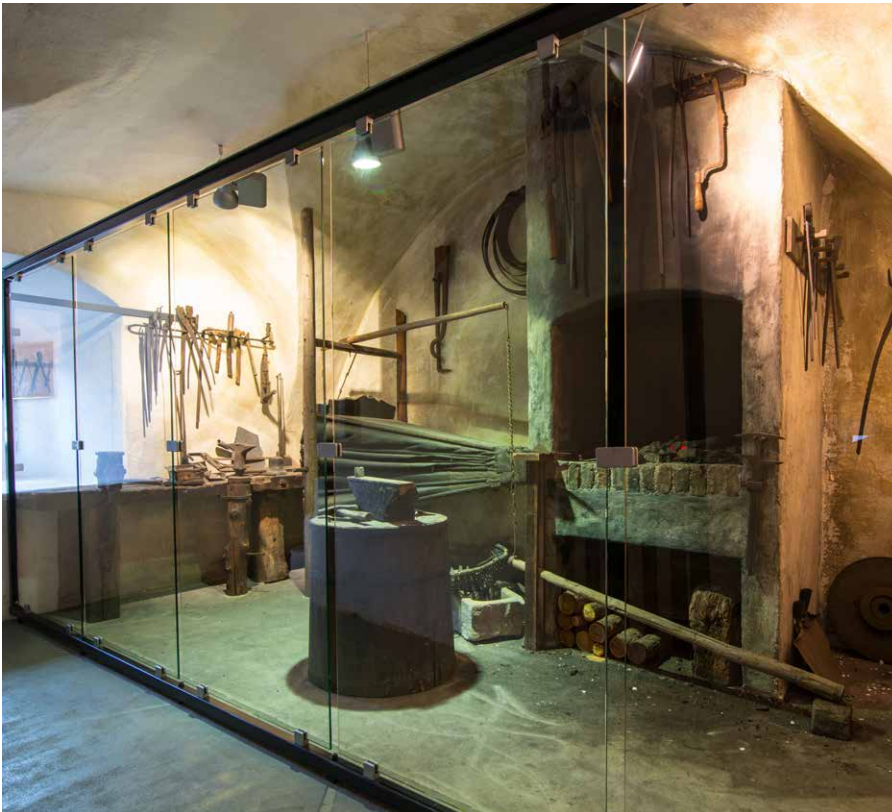
Die alte Schmiede im Stadtturm