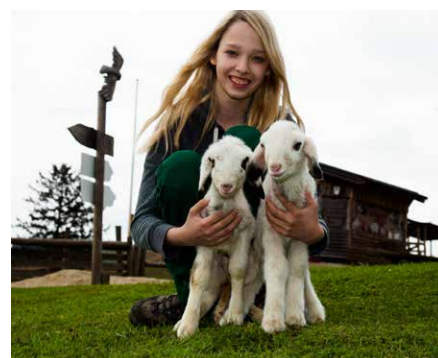
Streichelzoo für Groß und Klein