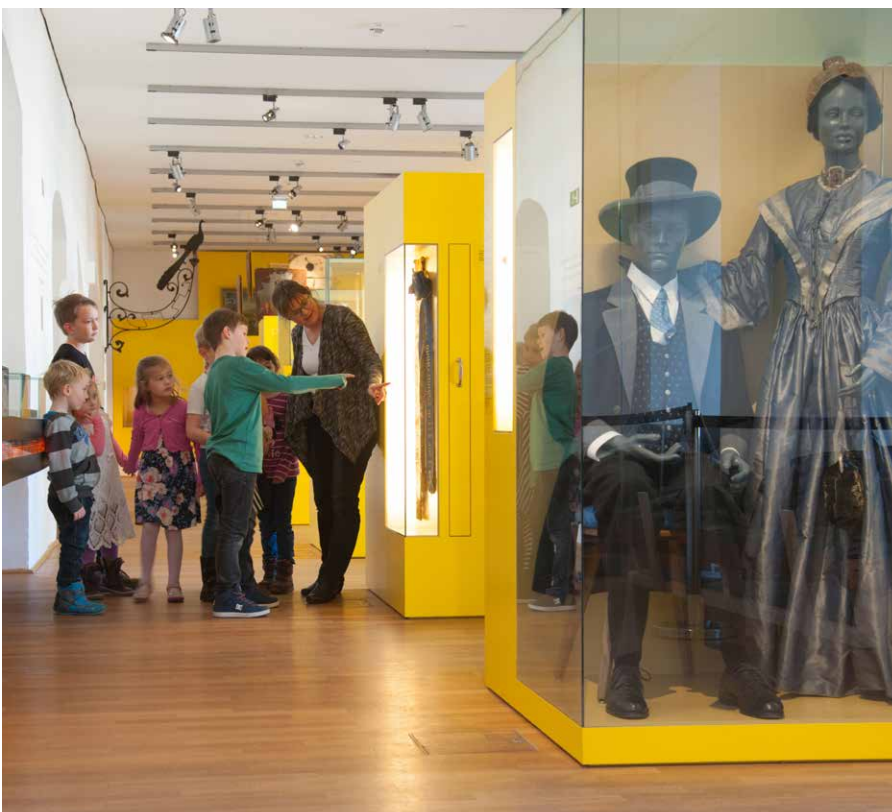
Das Element Erde im 5-Elemente Museum