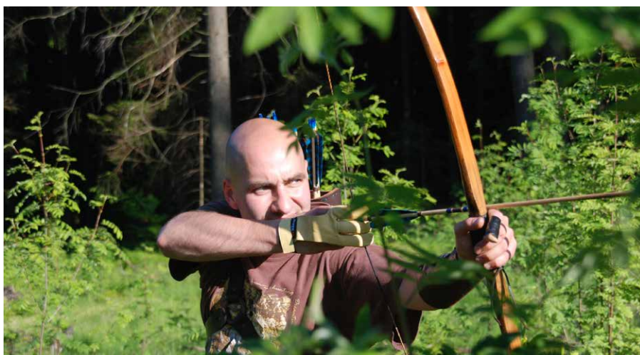
Auf der Pirsch durch die Wälder im 3D-Bogenparcour