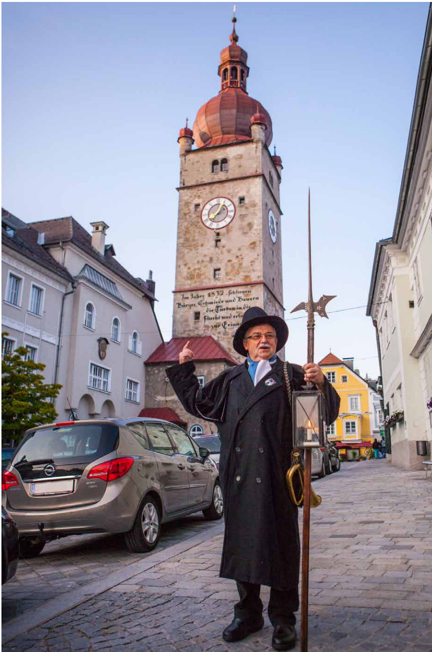
Ein Nachtwächter im Gespräch

Folgendes war passiert: Die Dame, die den Turm betreut hat, sperrte auf Grund eines Missverständnisses den Turm zu früh wieder ab und die Gruppe saß oben fest. Zum Glück war schnell wieder alles in Ordnung – auch der Bürgermeister scherzte später: „Das ist ja nett, dass ihr versucht, die Leute in Waidhofen festzuhalten, aber sie bleiben auch freiwillig gerne bei uns!“