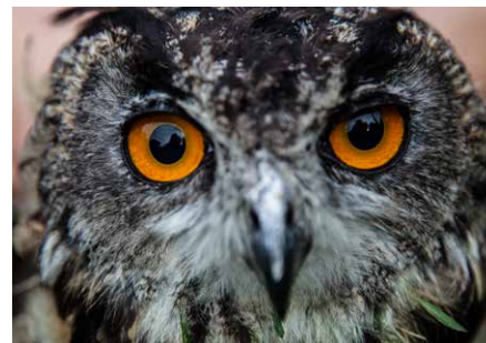
Heimische Wildtiere im Tierpark entdecken